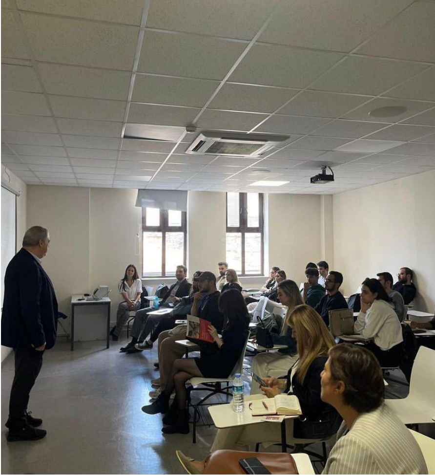
• Hanspaces Markalı dersi