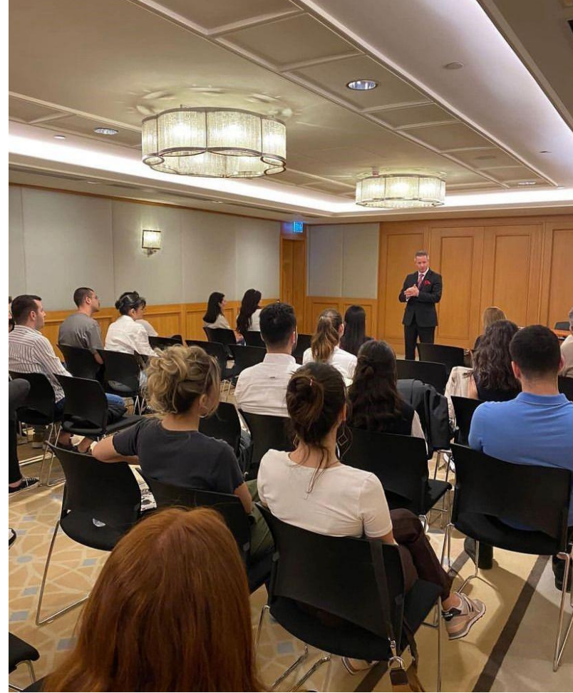
• Four Seasons Markalı dersi